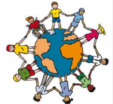
We zijn allemaal anders