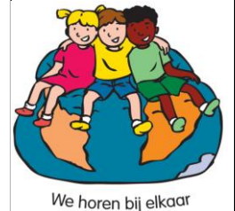
We horen bij elkaar

Om van een school of klas een groep te maken, is het nodig dat elk kind het gevoel heeft dat hij/zij er bij hoort. Kinderen hebben iets met elkaar als ze elkaar goed kennen en elkaar waarderen. Ze leren over opstekers en afbrekers.