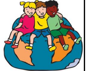
We horen bij elkaar

Om van een school of klas een groep te maken, is het nodig dat elk kind het gevoel heeft dat hij/zij er bij hoort. Kinderen hebben iets met elkaar als ze elkaar goed kennen en elkaar waarderen. Ze leren over opstekers en afbrekers.