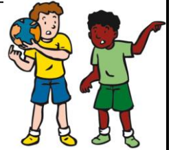
We lossen conflicten zelf op

We leren kinderen om op een positieve manier met conflicten om te gaan. De lessen zijn onder andere gericht op het verschil tussen conflict en ruzie. Een conflict is een verschil van mening: je wilt bijvoorbeeld allebei iets anders doen of hebben. Bij een conflict wil je een oplossing bedenken waar je allebei tevreden mee bent. Je zoekt naar win-win oplossingen.